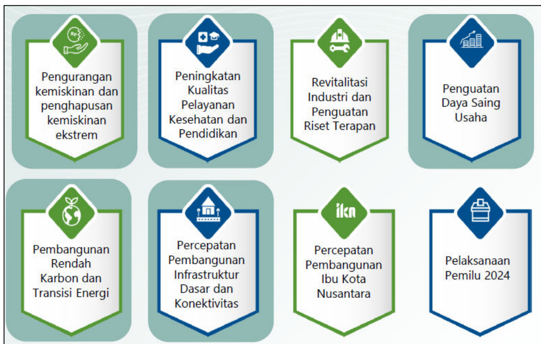
Gambar 3.1 Arah Kebijakan RKP Tahun 2024

Pada Tahun 2024, Tema Pembangunan Nasional yang ditetapkan dalam RKP Tahun 2024 adalah "Mempercepat Transformasi Ekonomi yang Inklusif dan Berkelanjutan" dengan 8 arah kebijakan sebagai berikut: